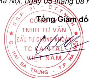
Đặng Quốc Hùng