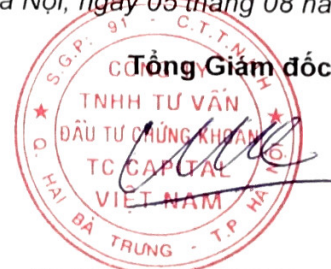
Đặng Quốc Hùng