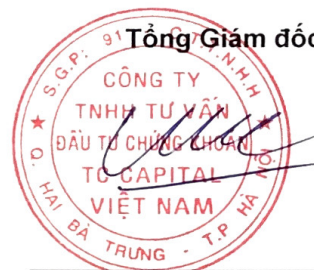
Đặng Quốc Hùng