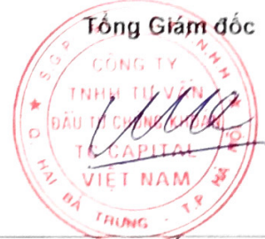
Đặng Quốc Hùng